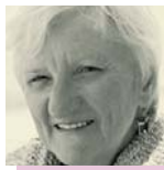
Par Monique Brillon, Ph. D.

D EPUIS quelques années, les recherches en neuro-immunologie démontrent l'interdépendance des systèmes immunitaire, endocrinien et nerveux. Grâce à elles, on comprend de mieux en mieux que le cerveau, siège de la pensée et des émotions, orchestre toutes les réactions physiologiques. L'être humain fonctionne comme un tout, l'esprit ayant un impact sur le fonctionnement du corps et vice-versa. Cela sous-entend que toutes les maladies ont à la fois un versant psychologique et un versant somatique. Les observations cliniques en psychosomatique révèlent, pour leur part, que le déclenchement des maladies, leur évolution et leur guérison s'inscrivent dans la totalité de l'être qui en est affecté. Elles portent la marque de son hérité et de l'énergie dont il dispose actuellement, mais aussi de sa personnalité, de son mode de fonctionnement mental, de ses mécanismes d'adaptation et de défense contre l'angoisse et de son image corporelle.