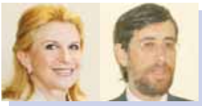
Par Linda Greenberg, M.A., et Abe Worenklein, Ph. D.

L A VIOLENCE conjugale est un problème concret. Elle peut prendre plusieurs formes, soit la violence physique et les menaces, l'agression sexuelle, ainsi que la violence psychologique ou émotionnelle. Elle a été définie comme étant « une tentative d'un partenaire de contrôler, de dominer et d'humilier l'autre en utilisant divers moyens, incluant la violence physique, sexuelle, psychologique, financière et spirituelle [...]. L'ensemble du comportement vise à maintenir un contrôle total [sur le conjoint]. Les chercheurs ainsi que les cliniciens reconnaissent que la violence domestique augmente habituellement en fréquence et en sévérité avec le temps 1 . »