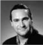
Par Carl Lacharité Ph. D.